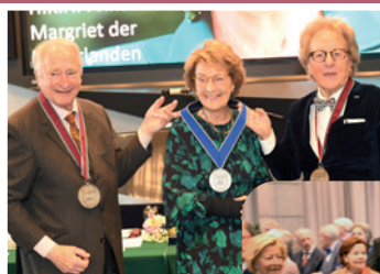
H.R.H. Princess Margriet of the Netherlands