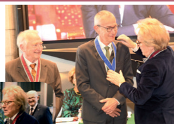
Vice-Premier of Belgium H.E. Prof. Dr. Frank Vandenbroucke